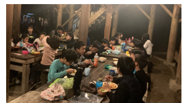
↑キャンプで夕食 ↓北海道