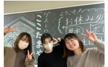
↑一橋祭で発表 ↓留学生プログラム