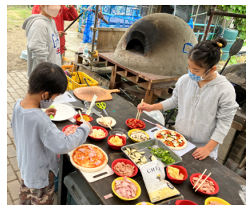
家族懇親会(畑でピザ焼き)