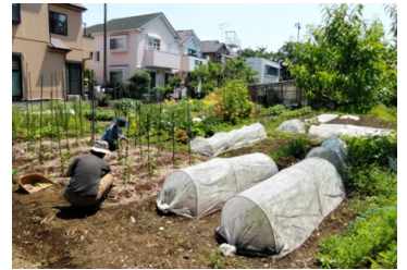
みんな畑で農作業