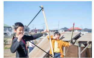
↓木工中 ↑木での遊具作り