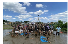
くにたちどろまみれ2022