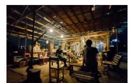
大きくなった母屋で語らう