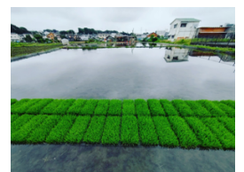
田植えを待つ苗が勢揃い