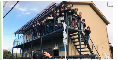
ここたまやに勢揃い

昨年度よりも民泊としての実績は少ないもののアパートとして長期滞在している住民が3名いて園の会事業にも関わっているのが実質的な稼働規模は広がりました。また「ここたまや」103号室を使って撮影された映画「PLAN75」がカンヌ国際映画祭でカメラドール賞を受賞し話題になるなど嬉しいニュースもありました。